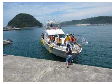
[上：栈橋製作作業 下：クルーザー乗船体験サポート]

『和歌山バリアフリーまつり』 inすさみ（主催：和歌山バリアフリーまつり実行委員会）