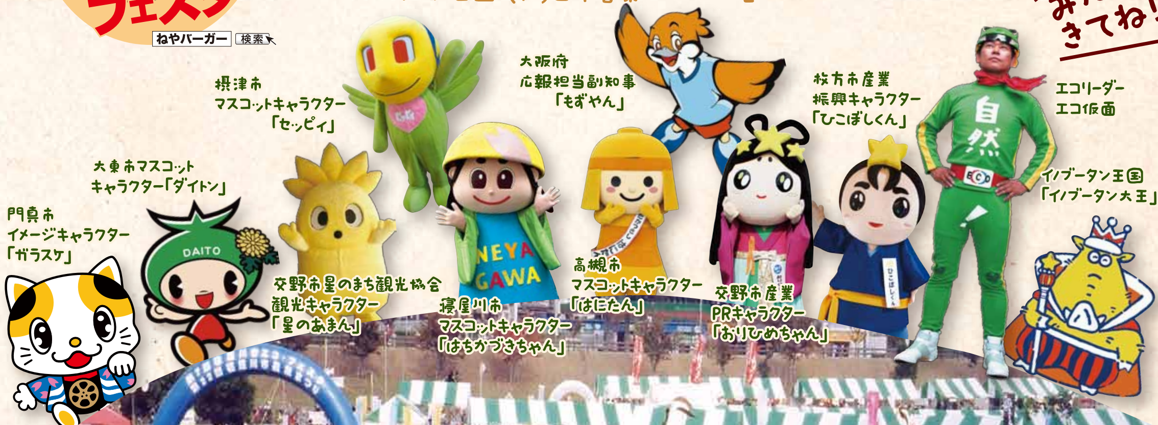
摂津市 マスコットキャラクター 「セッピー」