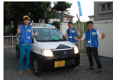
昨年10月で満5周年を迎えた 摂南大中沼研究室の 青パト活動

交流会には大阪の9つの大学(大阪工業大、大阪学院大、大阪産業大、大阪大谷大、関西大、関西外国語大、摂南大、阪南大、桃山学院大)などから安全・安心ボランティアに取り組む13団体、約70人の学生が参加。学生たちは、府警本部の府民安全対策課や少年課、府の治安対策課、青少年課等の担当者によるパネルディスカッションを聴講後、グループに分かれ、子ども・青少年を危険から守る方法について議論するほか、今後の活動の方向性を検討します。