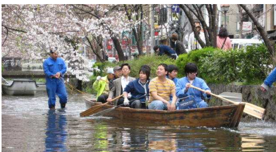
淀川愛好会 「田舟クルーズ」

寝屋川市との連携企画の例としては、地元小学校6年生の皆様対象の摂南大学一日体験入学や、すでに3年目を迎える市