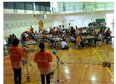
〔昨年の交流会のようす〕

※このイベントは、①道の駅すさみ、②イノブータンランド・すさみ、③すさみ海水浴場の3カ所で並行して行われます。学生が3カ所を循環するバスの添乗員として協力するほか、①では、子ども向けの遊び場(わなげやコイン落としなど)をイベントブースに設置。②では、学生が子どもを対象に石ころにお絵描きをする石ころアート、額縁づくり、大声コンテストなどのサポートを行います。