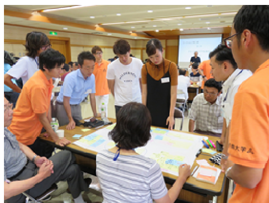
写真④：地域住民とのワークショップで、観光振興に関するアイデアを出し合う