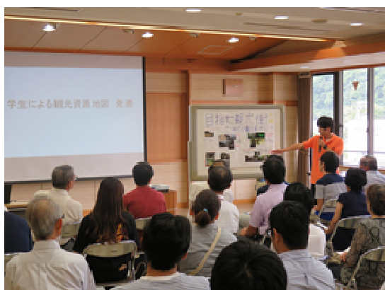
写真③：事前調査の結果を住民に向け発表