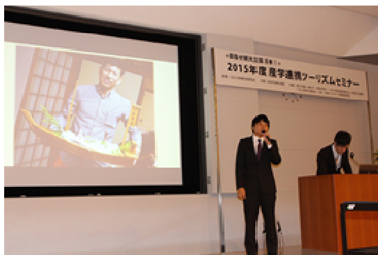
写真①：昨年度の発表の様子 テーマ「オプションルツアーの地域活性化に対するポテンシャル～和歌山県由良町の实地調査を通じて～」