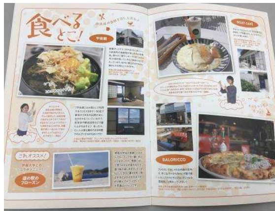
「観るとこ!」「食べるとこ!」「買うとこ!」 のシーン別におすすめスポットを紹介

摂南大学は、多角的な視点で地域の状況を分析して課題を発見し、持続可能なまちづくりに貢献できる知的専門職業人を育成するため、2016 年度に「ソーシャル・イノベーション副専攻課程」を設置しました。3 年次配当科目「地域貢献実践演習」の履修学生が、これまで同課程で学修した内容を地域に還元することを目的に活動を展開しています。今般の「ゆらまふ」の製作も本活動の一環として実施しているものです。