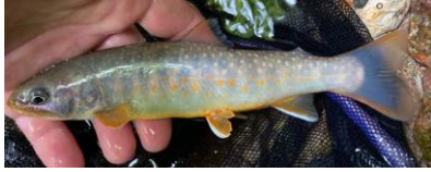
日本海型（ニッコウイワナ）