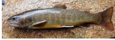
太平洋型（ヤマトイワナ）