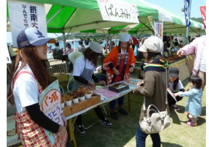
模擬店参加 (昨年イベント時)

昨年度、大学のふるさと協定の調印を行ったすさみ町と摂南大学が、当該活動の一つとして、「イノブータン王国建国祭」における学生による模擬店参加や生ライブ演奏、佐本地区における「なんでもやる隊」活動として高齢者宅訪問などを実施します。