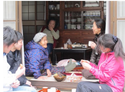
お元気ですか？ 高齢者宅を訪問