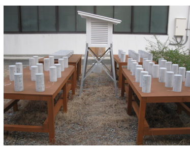
図-1 長期屋外暴露試験

セメントをバインダーとする補修用モルタルにポリマーを添加することは、既存の技術となっている。本研究では、コンクリートへのポリマーの添加を耐久性を向上させる長寿命化技術として位置付け、天然骨材や再生骨材を用いたコンクリートの耐久性や乾燥収縮特性に関する実験的検討を行っている(図-1)。なお、ポリマーにはSBR(スチレンブタジエンゴムラテックス)を使用した。その結果、SBR をセメントに対する質量比で 10%添加したものは無添加のものに比べて乾燥収縮が 50%程度になること(図-2)、CO 2 の侵入による鉄筋コンクリートの劣化である中性化の速度がSBR10%とすること収で著しく抑制できること等を明らかにしている(図-3)