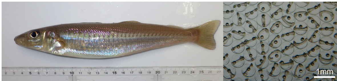
図. シロギス成魚（左）と卵の写真（右）（海生研提供）