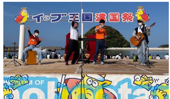
昨年のイノブータン王国建国祭の様子