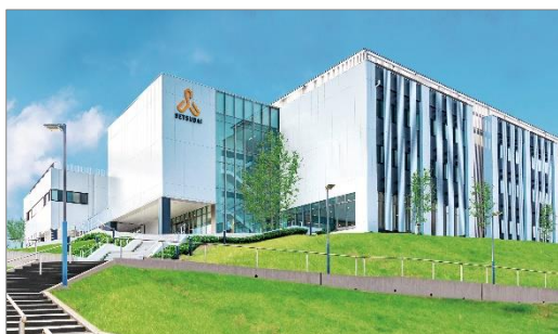
摂南大学枚方キャンパス（看護学部が立地）