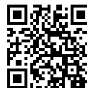
お問い合わせフォーム

URL https://www.setsunan.ac.jp/inquiry/form/?id=113