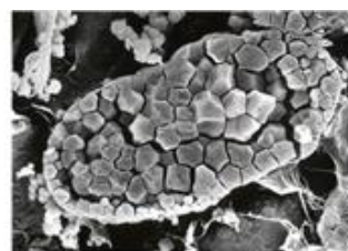
サトイモ球茎のアミロプラスト(澱粉粒を蓄積する細胞小器官)の凍結断面(走査電子顕微鏡像)