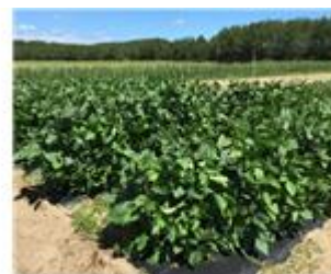
在来マメ科作物の砂地圃場での栽培試験区