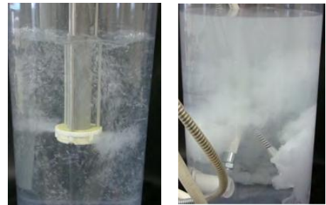
マイクロナノバブル発生装置 (左)気液二相流旋回方式、(右)加圧溶解方式