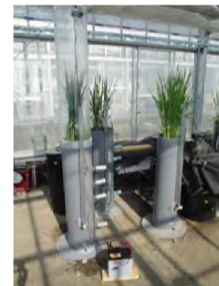
マイクロナノバブルを用いた温室内での 稲の栽培実験