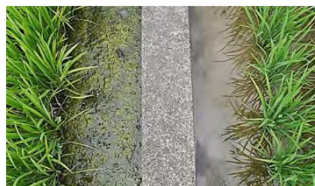
稲の慣行農法と有機農法による比較栽培実験 (左) 慣行農法、(右) 有機農法