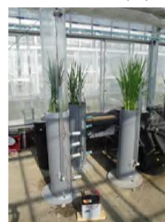
マイクロナノバブルを用いた温室内での 稲の栽培実験