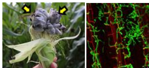
(左) カビにより肥大化したトウモロコシの組織 (右) 植物組織内に蔓延するカビの顕微鏡写真