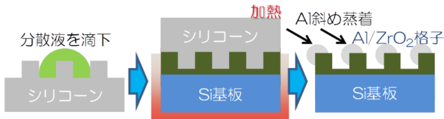
図1 ゾル-ゲル法、インプリント法、真空蒸着法による赤外用ワイヤグリッド偏光子の作製プロセス。

その一例として、干渉露光法で得られるフォトレジストパターンをシリコンに構造を転写し、それをモールドとしてインプリント法とゾル-ゲル法などを併用して（図1）、狭周期構造（周期400nm以下）を要するワイヤグリッド偏光子（図2）や、波長板、回折効率の高い回折格子などの作製を電子線リソグラフィや、ドライエッチング装置を用いずに行うことができ、現在は実用化に向けて大面積化を目指すとともに、応用可能なデバイスの探索も行っています。