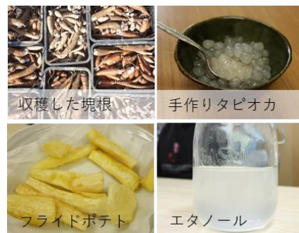
多様なキャッサバの利用法