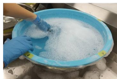
図1. 大量調理器具を洗浄している様子