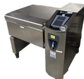
図2. 給食施設で使用されている大量調理機器の例