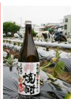
都市農地を守るファームマイレージ商品