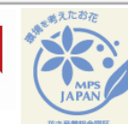
エシカル消費に役立つマークとキャラクター