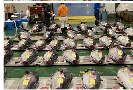
写真上：電鉄系食品SMの水産売場(神奈川・川崎市) 写真下：豊洲市場のマグロのセリ場(東京・江東区)